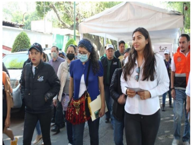
11 de Marzo 2023, Colonia la Joya.