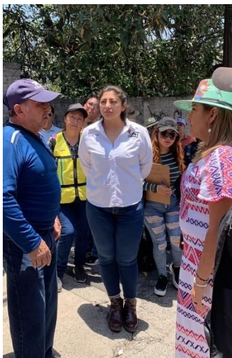
21 de junio, Pedregal de San Nicolás.