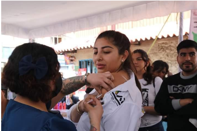
8 de Febrero 2023, Granjas de Coapa.