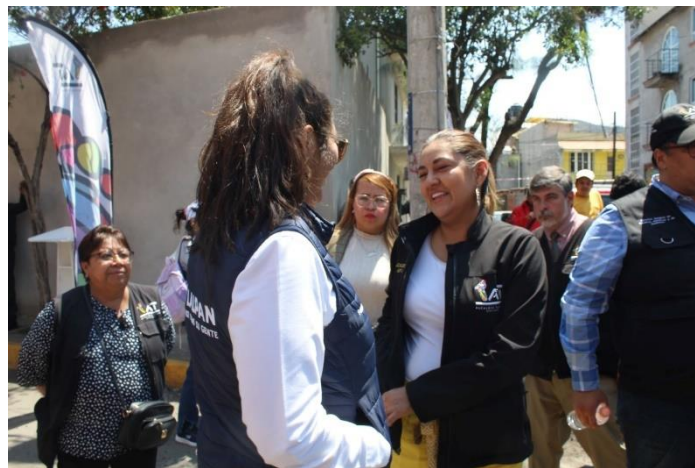
17 de Marzo, Parque la Tortuga