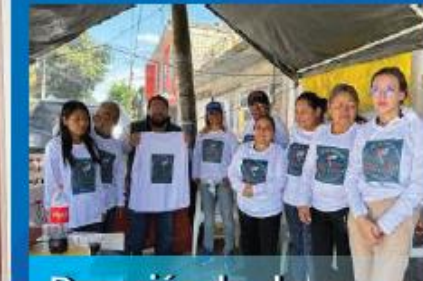
Donación de playeras a las y los compañeros del colectivo "pozo de la resistencia". 26 de Septiembre de 2023