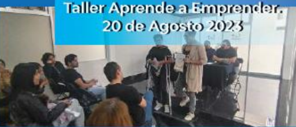
Taller Aprende a Emprender. 20 de Agosto 2023