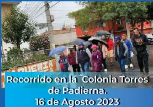
Recorrido en la Colonia Torres de Padierna. 16 de Agosto 2023