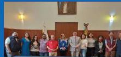
Vigésima segunda sesión del Concejo de la Alcaldía Tlalpan. 29 de Septiembre 2023