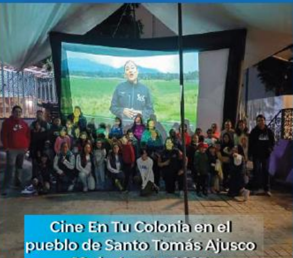
Cine En Tu Colonia en el pueblo de Santo Tomás Ajusco 10 de Agosto 2023