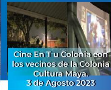
Cine En T u Colonia con los vecinos de la Colonia Cultura Maya. 3 de Agosto 2023