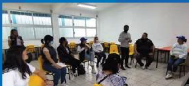
Reunión en la Escuela "Antonio Sánchez Molina" en Pedregal de San Nicolás 1ra sección. 9 de Junio 2023