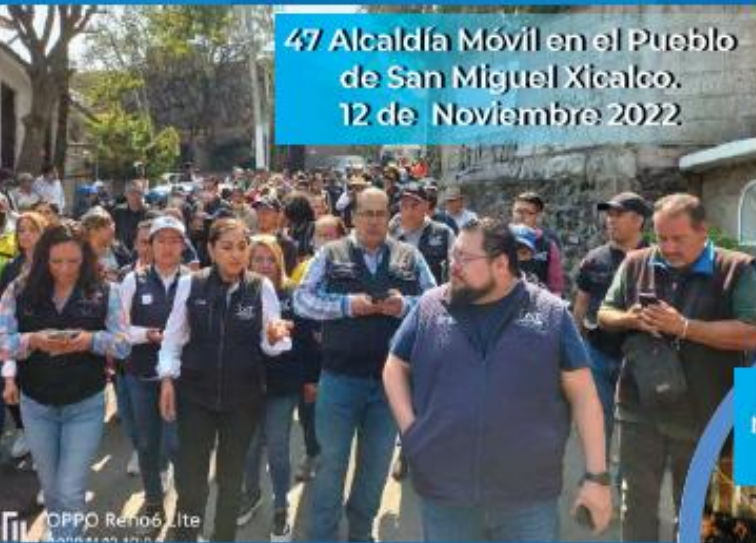
47 Alcaldía Móvil en el Pueblo de San Miguel Xicalco. 12 de Noviembre 2022.