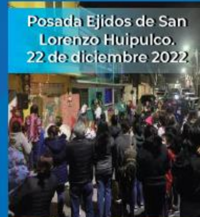
Posada Ejidos de San Lorenzo Huipulco. 22 de diciembre 2022