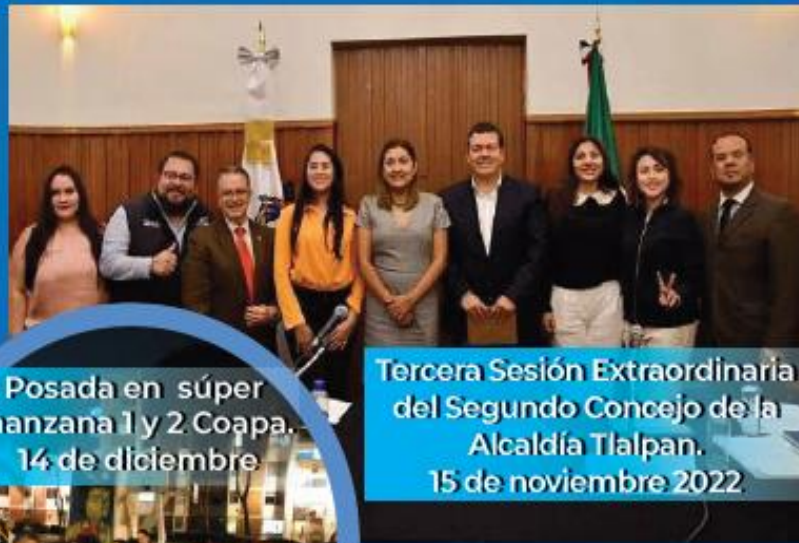
Tercera Sesión Extraordinaria del Segundo Concejo de la Alcaldía Tlalpan. 15 de noviembre 2022