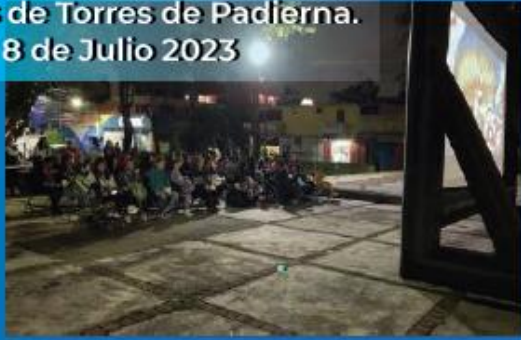
Cine En Tu Colonia con los vecinos de Torres de Padierna. 8 de Julio 2023