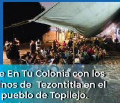
Cine En Tu Colonia con los vecinos de Tezontitla en el pueblo de Topilejo. 16 de Agosto 2023