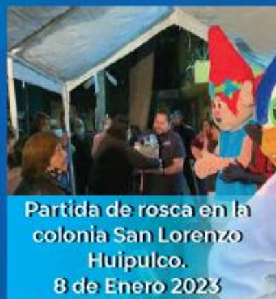
Partida de rosca en la colonia San Lorenzo Huipulco. 8 de Enero 2023