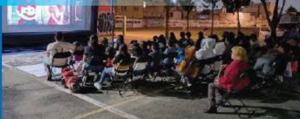
Cine En Tu Colonia con los vecinos de Cantera Puente de Piedra. 20 de Julio 2023