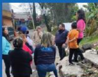
Recorrido en la colonia Encinos. 30 de Mayo 2023