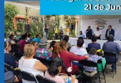
Asamblea Itinerante de seguridad en Pedregal de San Nicolás Ira sección. 21 de Junio 2023