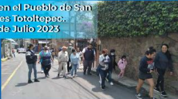
Recorrido en el Pueblo de San Andres Totoltepec. 22 de Julio 2023