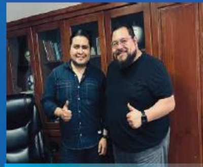
Reunión con el Presidente Municipal Rafa Vargas de Huitzilac Morelos. 20 de Septiembre 2023