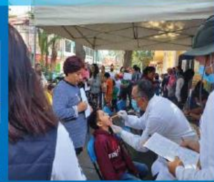
Jornada de certificados médicos en el Pueblo de San Lorenzo Huipulco. 24 de Agosto 2023