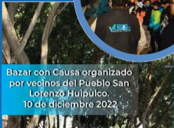
Bazar con Causa organizado por vecinos del Pueblo San Lorenzo Huipulco. 10 de diciembre 2022