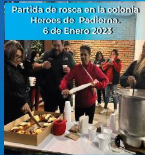
Partida de rosca en la colonia Heroes de Padlierna. 6 de Enero 2023