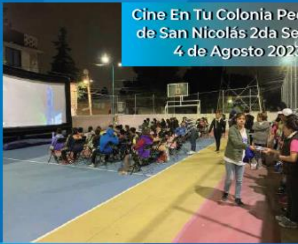
Cine En Tu Colonia Pedregal de San Nicolás 2da Sección 4 de Agosto 2023