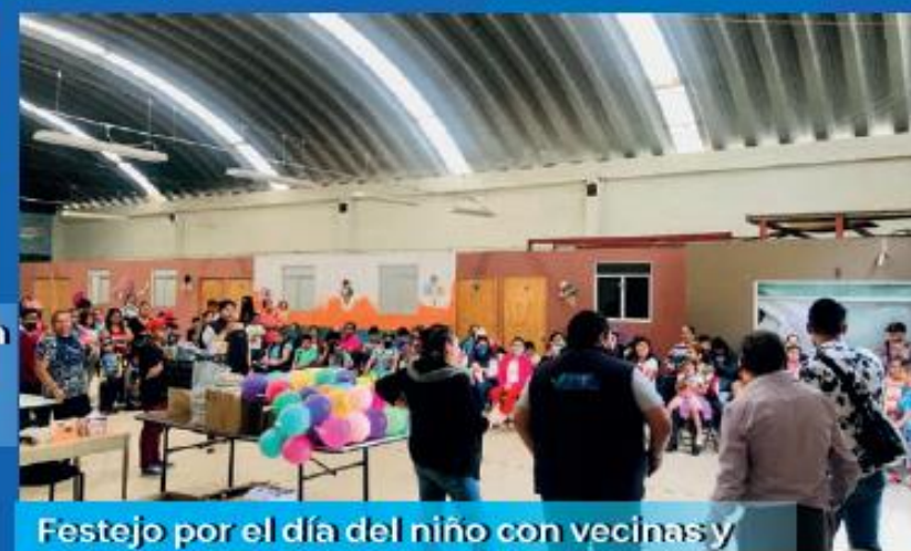
Festejo por el día del niño con vecinas y vecinos de la Miguel Hidalgo. 5 de Mayo 2023