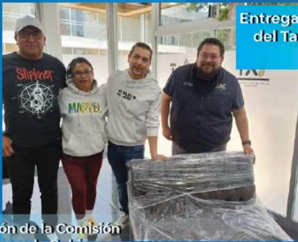
Entrega de Apoyos a los integrantes del Taller Aprende a Emprender. 4 de Septiembre