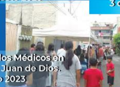
Jornada de Certificados Médicos en EX Hacienda de San Juan de Dios. 23 de Agosto 2023