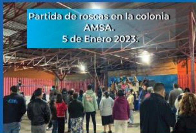
Partida de rosca en la colonia AMSA. 5 de Enero 2023.