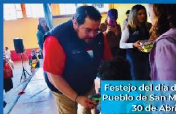
Festejo del día del niño en el Pueblo de San Miguel Ajusco. 30 de Abril 2023