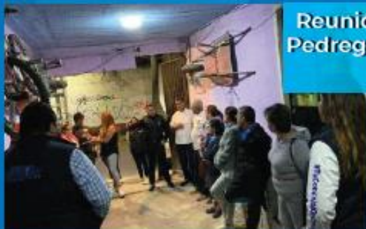
Reunión con vecinas y vecinos del Pedregal de San Nicolás 2a Sección. 3 de Mayo 2023