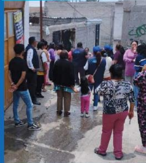
Recorrido en el pueblo de San Miguel Topilejo. 8 de Julio 2023