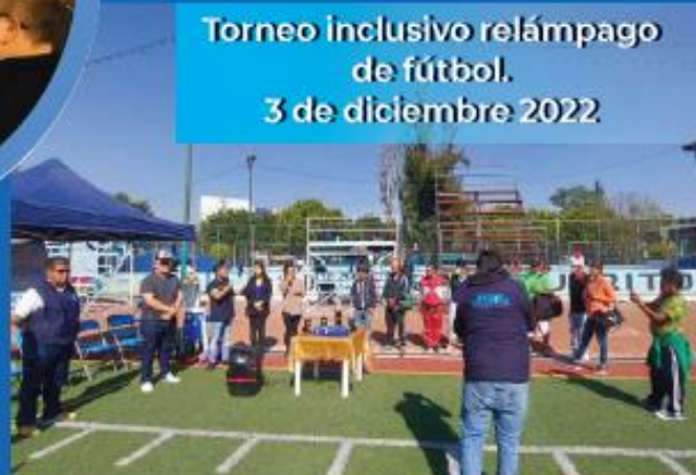
Torneo inclusivo relámpago de fútbol. 3 de diciembre 2022.