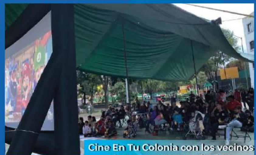
Cine En Tu Colonia con los vecinos de San Lorenzo Huipulco. 21 de Julio 2023