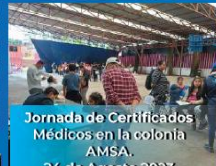
Jornada de Certificados Médicos en la colonia AMSA. 24 de Agosto 2023