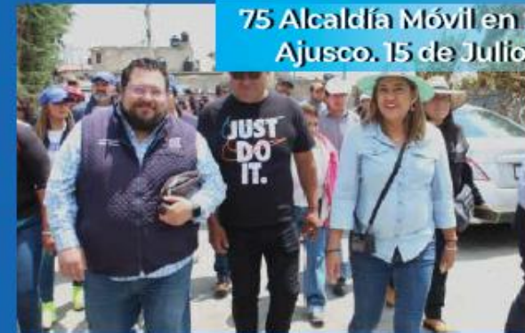
75 Alcaldía Móvil en San Miguel Ajusco. 15 de Julio de 2023