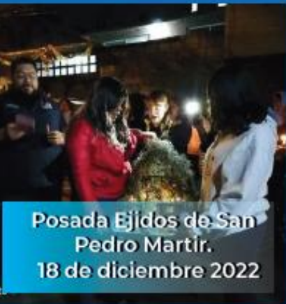
Posada Ejidos de San Pedro Martir. 18 de diciembre 2022